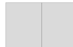
Pagina intera 230x290 mm Doppia intera 460x290 mm

I formati accettati sono Pdf, Jpg e Tiff. Il formato del file deve prevedere 5 mm di abbondanza per ogni lato sul formato finito (esempio sulla pagina intera 23x29 il formato file sarà 24x30). Prima dell'esportazione del file nei formati pdf, jpg e tif accertarsi di aver impostato il profilo colore per la stampa in quadricromia CMYK (profilo colore Coated FOGRA39) e di aver incorporato i font utilizzati per la realizzazione del file. Qualora i file inviati non rispettino il profilo colore descritto verranno automaticamente convertiti secondo le nostre specifiche prima di andare in stampa. La risoluzione del file e delle singole immagini presenti deve essere impostata a 300 dpi.